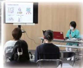
かんごちゃんも まじめに聞いています！