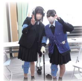
高齢者疑似体験も してみました！