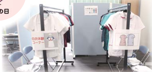
白衣体験！ 選んで着てみました！