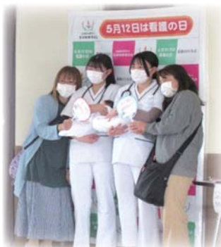
お母さんと記念撮影！