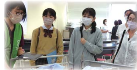
シミュレーターを使った演習見学