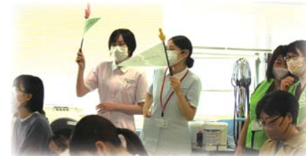
看護学生と学校内の探検ツアー