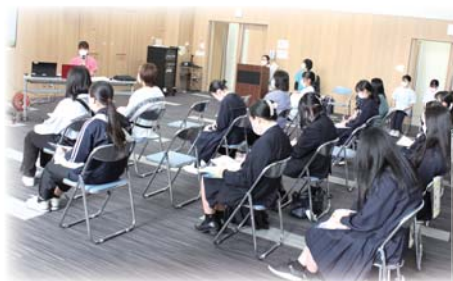
看護の出前講座では皆さん メモをとりながら聞いていました