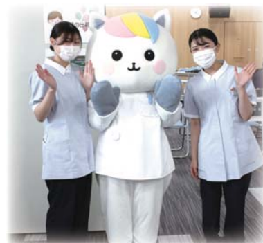
かんごちゃんと演者も一緒にパチリ！