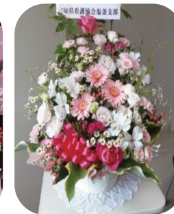
▲贈ったフラワーアレンジメント