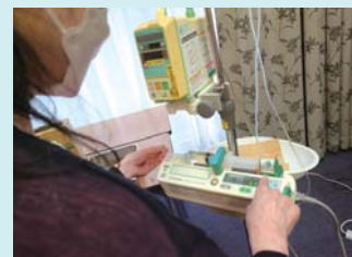
シリンジポンプの演習

実習内容 ：診療の補助（採血・吸引・注射） 日常生活の援助（移乗・移送・食事介助・体位変換）