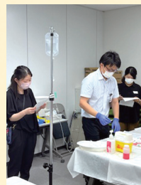
デモンストレーション様子▶