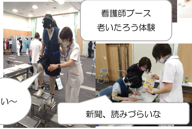
看護師ブース 老いたろう体験